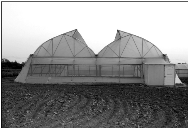
ਚਿੱਤਰ 3 : ਪੌਲੀ ਹਾਊਸ

ਪੌਲੀ ਹਾਊਸ ਦਾ ਢਾਂਚਾ (ਚਿੱਤਰ-3) ਜਿਸਤੀ ਪਾਈਪਾਂ ਦਾ ਬਣਿਆ ਹੁੰਦਾ ਹੈ ਜਿਸ ਨੂੰ ਉਪਰੋਂ ਅਤੇ ਪਾਸਿਆਂ ਤੋਂ ਪਾਰਦਰਸ਼ੀ ਪਲਾਸਟਿਕ ਦੀ ਸ਼ੀਟ ਨਾਲ ਢਕਿਆ ਹੁੰਦਾ ਹੈ । ਇਸ ਵਿੱਚ ਫ਼ਸਲਾਂ ਦੀ ਕਾਸ਼ਤ ਕੀਤੀ ਜਾ ਸਕਦੀ ਹੈ । ਪੌਲੀ ਹਾਊਸ ਵਿੱਚ ਵਾਤਾਵਰਣ ਨੂੰ ਫ਼ਸਲ ਦੀ ਲੋੜ ਅਨੁਸਾਰ ਕੰਟਰੋਲ ਕੀਤਾ ਜਾ ਸਕਦਾ ਹੈ । ਇਹ ਨੈੱਟਹਾਊਸ ਨਾਲੋਂ ਮਹਿੰਗਾ ਹੁੰਦਾ ਹੈ ਪਰ ਇਸ ਵਿੱਚ ਸੁਖਾਵਾਂ ਵਾਤਾਵਰਣ ਹੋਣ ਕਰਕੇ ਫ਼ਸਲ ਛੇਤੀ ਤਿਆਰ ਹੋ ਜਾਂਦੀ ਹੈ ਅਤੇ ਫ਼ਸਲ ਦੀ ਕੁਆਲਿਟੀ ਵੀ ਵਧੀਆ ਹੁੰਦੀ ਹੈ । ਪੌਲੀ ਹਾਊਸ ਵਿੱਚ ਪ੍ਰਕਾਸ਼ ਸੰਸਲੇਸ਼ਣ ਦੀ ਦਰ ਲਗਪਗ ਪੰਦਰਾਂ ਗੁਣਾਂ ਵਧੇਰੇ ਹੋਣ ਕਰਕੇ ਝਾੜ ਕਈ ਗੁਣਾ ਵਧ ਜਾਂਦਾ ਹੈ । ਪੌਲੀ ਹਾਊਸ ਫ਼ਸਲ ਨੂੰ ਵਰਖਾ, ਕੋਚੇ, ਕੀੜੇ ਮਕੌੜੇ ਅਤੇ ਬਿਮਾਰੀਆਂ ਤੋਂ ਸੁਰੱਖਿਆ ਪ੍ਰਦਾਨ ਕਰਦਾ ਹੈ । ਪੌਲੀ ਹਾਊਸ ਵੱਖ ਵੱਖ ਫ਼ਸਲਾਂ ਦੀ ਪਨੀਰੀ ਪੈਦਾ ਕਰਨ ਲਈ ਵੀ ਵਰਤੇ ਜਾ ਸਕਦੇ ਹਨ । ਪੰਜਾਬ ਐਗਰੀਕਲਚਰਲ ਯੂਨੀਵਰਸਿਟੀ ਲੁਧਿਆਣਾ ਵੱਲੋਂ ਵੀ ਪੌਲੀ ਹਾਊਸ ਵਿੱਚ ਸ਼ਿਮਲਾ ਮਿਰਚ ਅਤੇ ਟਮਾਟਰ ਦੀ ਕਾਸ਼ਤ ਕਰਨ ਦੀ ਸਿਫ਼ਾਰਸ਼ ਕੀਤੀ ਗਈ ਹੈ ।